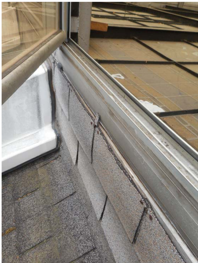
El perfil que recoge la impermeabilización se interrumpe en las ventanas abatibles para permitir su apertura, podría ser un foco de patologías permitiendo la entrada de agua por debajo de la tela asfáltica. Clavos de sujeción de la impermeabilización oxidados.