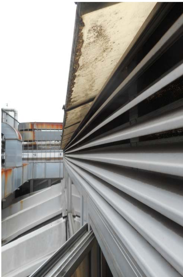
Vista exterior de rejilla de ventilación, y vuelo del vidrio del lucernario.