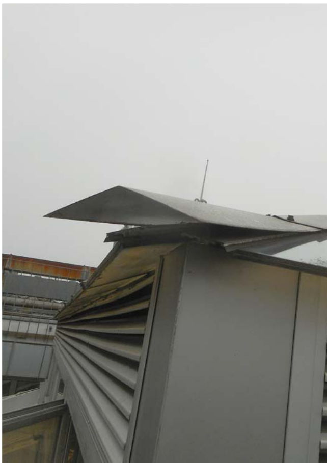
Albardilla de limahoya doblada en los extremos, posiblemente por la acción del viento, y falta de tornillos en el tramo final.